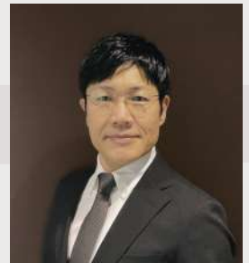
NEXT Business Consulting

対象は流通小売業、サービス業、飲食業、卸売業、製造業、素材産業まで幅広い。耳障りのいい精神論と綺麗ごとではなく、現在の大手を小～中～大へと育てた企業成長の原理原則により顧問企業の状態と業績を健全化させ、さらなる成長へと導くことをテーマとする。企業競争力の強化、収益性の向上、成長政策の実現に実績が多くその実現率の高さには特筆すべきものがある。